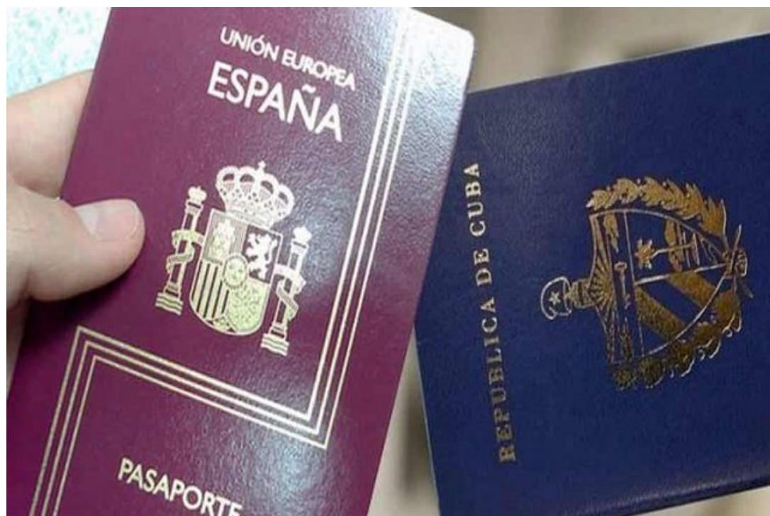
La iniciativa que irá a consulta popular del 13 de agosto al 15 de noviembre propone el principio de la ciudadanía efectiva.

El proyecto de nueva Constitución de Cuba representa una reforma total de la carta magna vigente desde 1976, con el tema de la ciudadanía como uno de los que cambia.